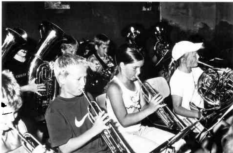
Die Bläsergruppe der Marienschule im Einsatz

Eröffnung, Begrüßung und Ehrung verstorbener Mitglieder Feststellung der ordnungsgemäßen Ladung Verlesung des Protokolls der letzten Mitgliederversammlung Bericht des Vorsitzenden Bericht des Schatzmeisters Bericht der Rechnungsprüfer: Kasse Heimatverein – Entlastung des Schatzmeisters Kasse Interessengemeinschaft Telbrake – Entlastung Bericht der Fachbereichsleiter – Arbeitsgemeinschaften Entlastung des Vorstandes Wahl eines Kassenprüfers Anträge Verschiedenes Schluss: Dia-Vortrag „Was war los in Oythe 2006?“