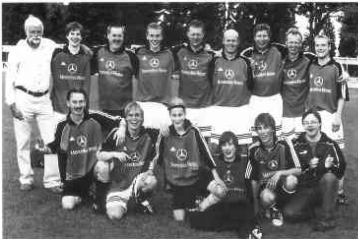
Gewinner des Dorfpokals: Mannschaft „Lange Wand/ Jagdhornstr.“