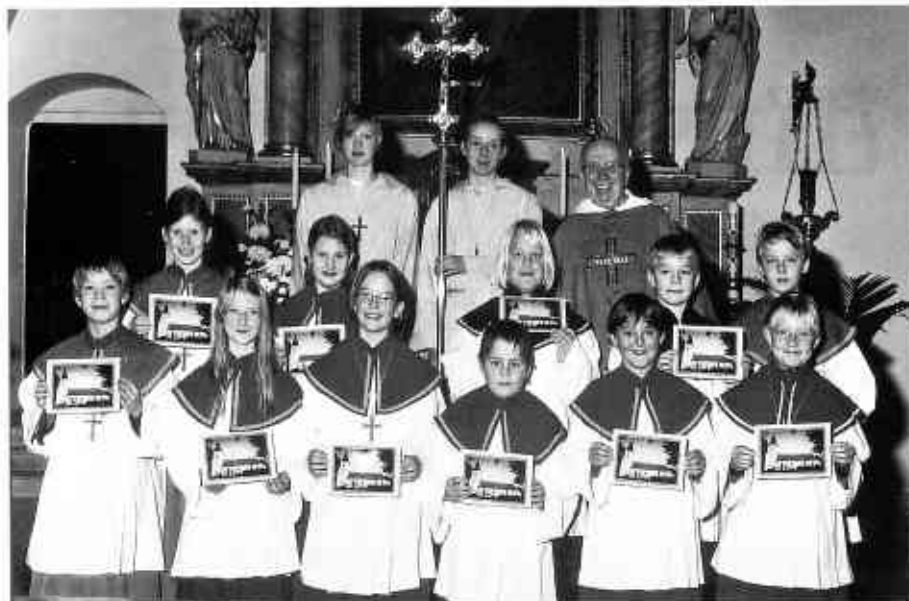
Die neuen Oyther Messdiener