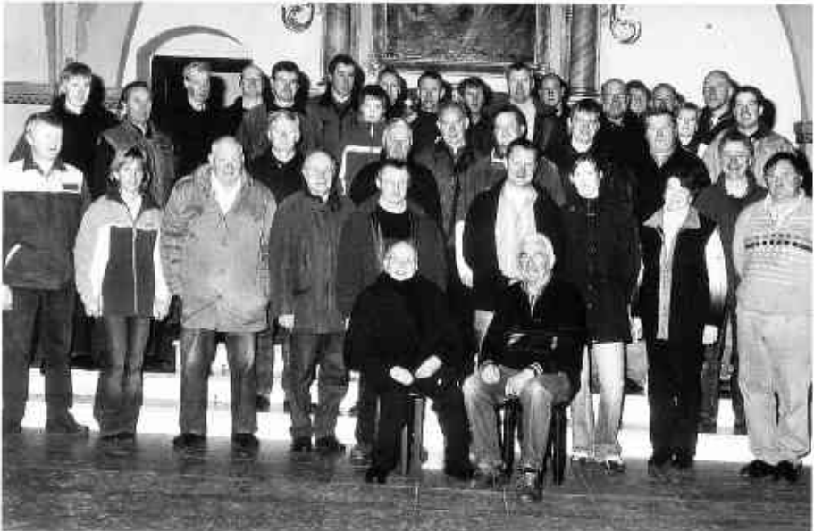
Die „Schleppergruppe“ nach dem Ausräumen der Kirche.