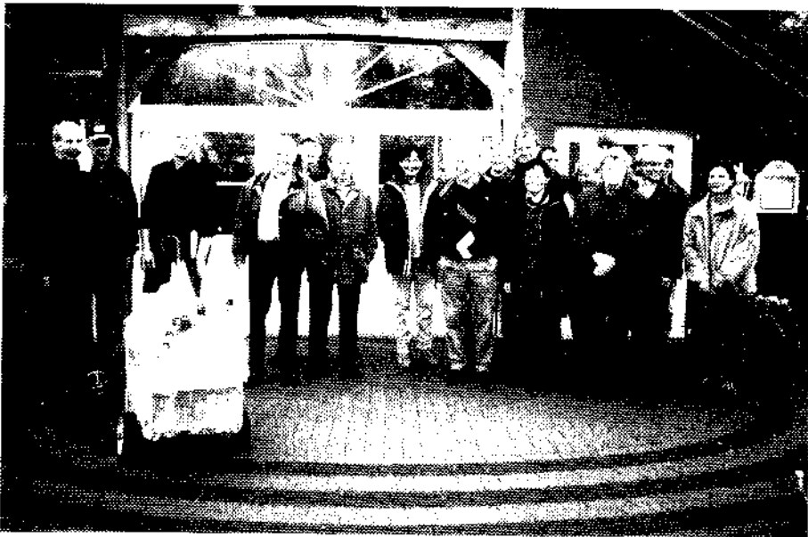
Boßeltour des Vorstandes - Treffen beim Birkenhof in Lutten