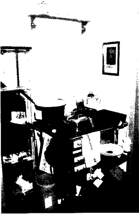
Ausstellung "Haushalt früher"